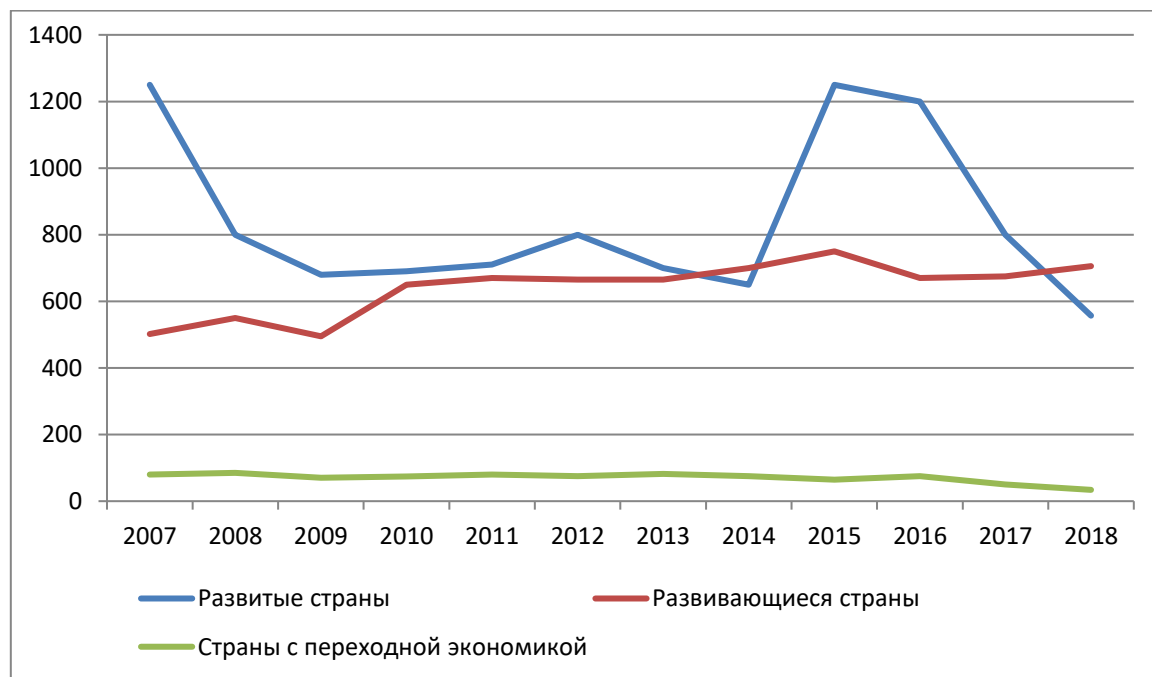
Рисунок 2.1. Приток ПИИ, во всем мире и по экономическим группам в 2007-2018 гг., млрд. долл. *