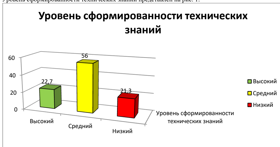
Рисунок 1. Уровень сформированности технических знаний

Уровень сформированности технических знаний представлен на рис. 1.