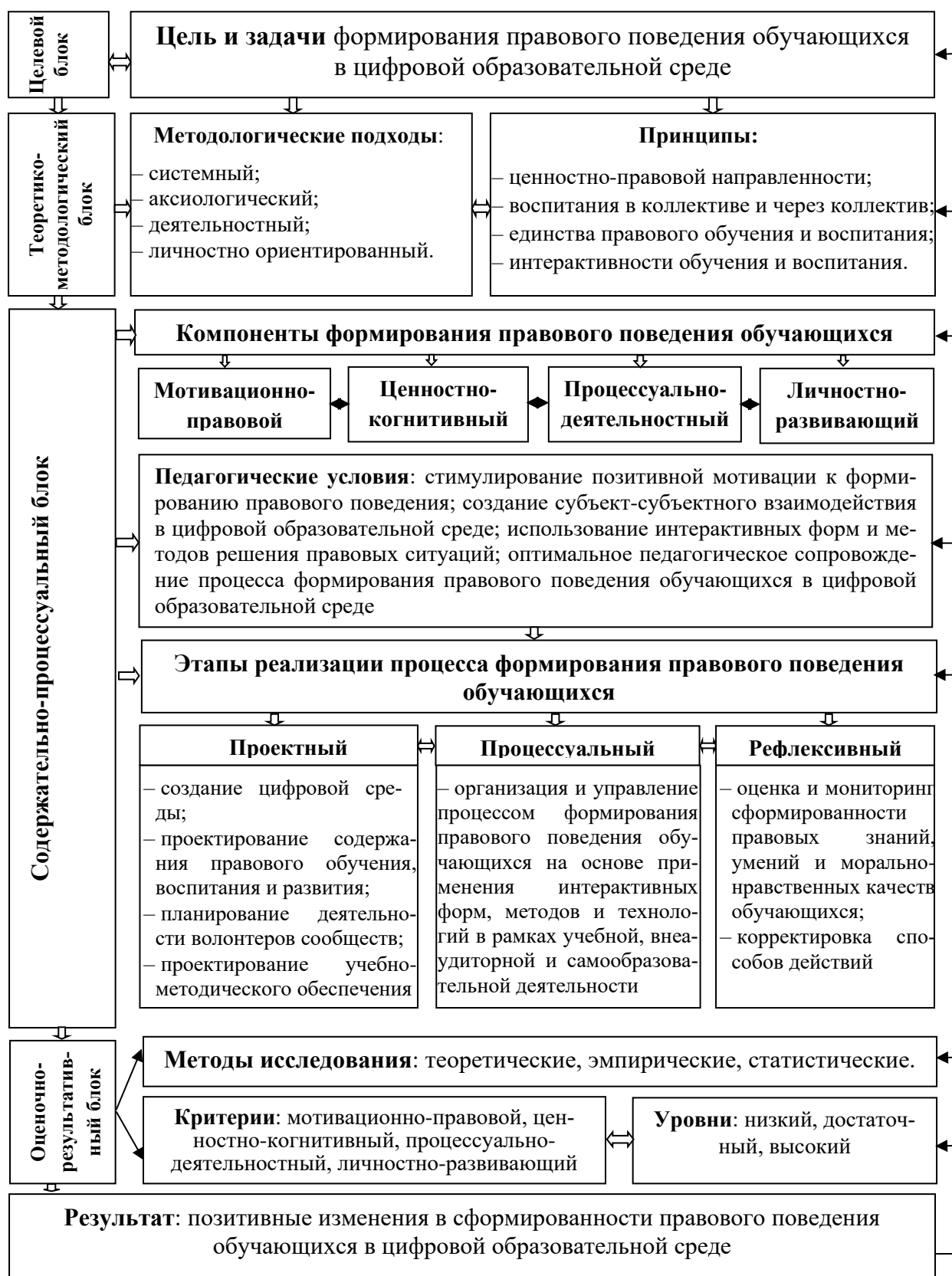
Рисунок 1. Модель формирования правового поведения обучающихся в цифровой образовательной среде

Модель формирования правового поведения обучающихся в цифровой образовательной среде включает структурные составляющие, отображающие целостный процесс формирования комплекса правовых знаний, умений, лич-