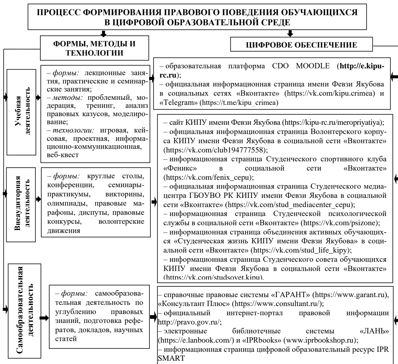
Рисунок 2. Системная работа по формированию правового поведения обучающихся в цифровой образовательной среде

К особенностям организации образовательного процесса, направленного на формирование правового поведения обучающихся в цифровой образовательной среде, относятся учебная, внеаудиторная и самообразовательная деятельность [Рисунок 2].